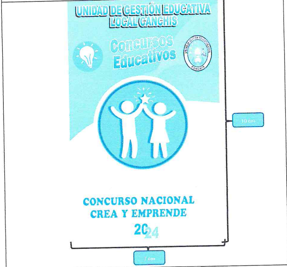
IMAGEN DE REFERENCIA DE FOTOCHECK DE 7 CM X 10CM DE LARGO

MEDIDAS DE LA CINTA Medida: 1cm ancho Aprox. Medida: 45cm largo Aprox. Color: Azul Oscuro.